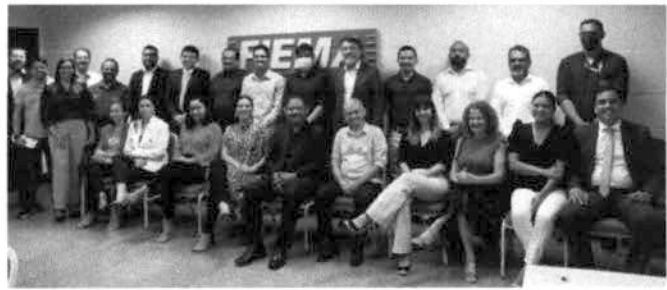
Membros do Conselho temático da FIEMA na reunião com a titular da SEMA

resíduos eletrônicos. Ambas as empresas são parceiras da Federação das Indústrias (FIEMA).